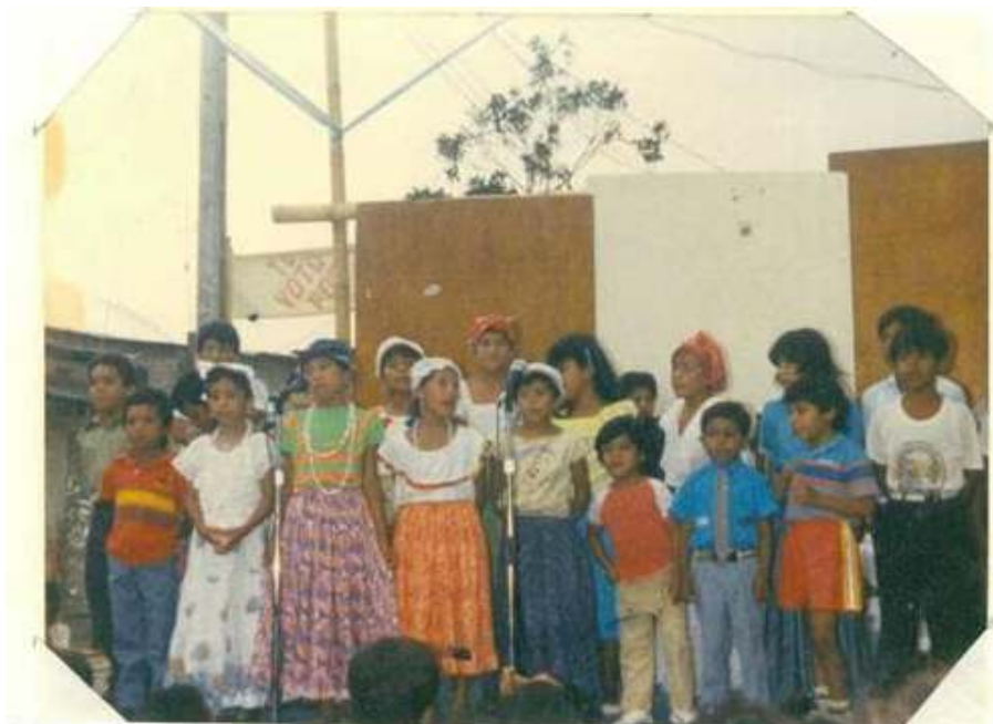
Foto No 2: Niños del Taller Las Palmas interpretando “Casitas del Guasmo”

culturales y comités de padres de familia que trabajaban “activamente por alcanzar mejoras para el barrio” (Barriada 1988).