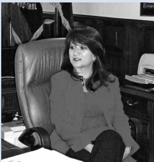
Entrevista* a Lorena Escudero Ministra de Defensa

"Buscamos una política de defensa basada en la equidad, el desarrollo, los derechos humanos y la seguridad humana".