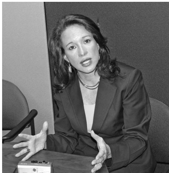
Entrevista a María Fernanda Espinosa, Ministra de Relaciones y Comercio Exterior

"A la cancillería hay que ponerle un poco de poesía y de verde"